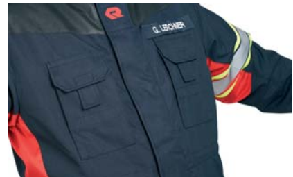
To bryst lommer for radio