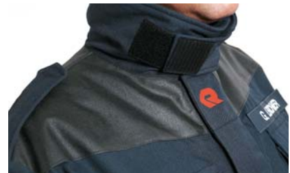
Tilleggsforsterkning på skuldrene