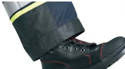
Tilleggsforsterkninger på knærne, sidene og nederkantene av buksebena