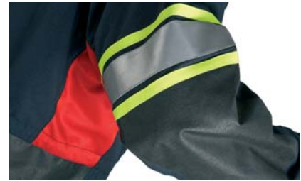
Slitasjeforsterkninger på albuer og i sidene