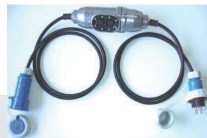
RO 933008 / RO 933009