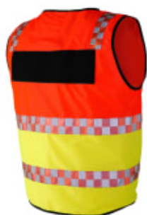
Klick fast radioholder